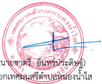
(นายชาติ อินทร์ประดิษฐ์) นายกเทศมนตรีตำบลหนองน้ำใส

ประกาศ ณ วันที่ ๒๖ เดือน เมษายน พ.ศ.๒๕๖๗