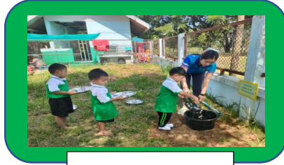
ภาพบ่อขยะเปียก