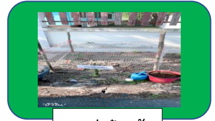
ภาพบ่อปุ๋ยหมัก