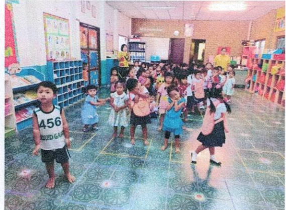
ภาพที่ ๑ กิจกรรมการสอนความซื่อสัตย์สุจริต